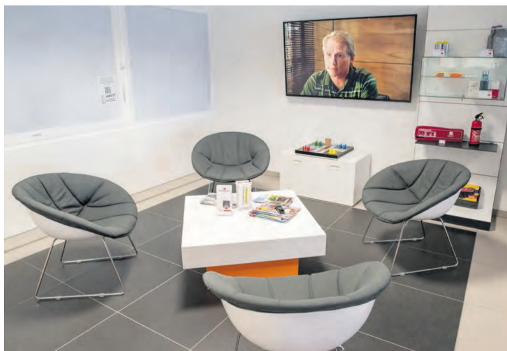
In der Lounge können es sich die Kunden bequem machen.

Firmengründer, der im April 1972 seinen Betrieb in Roßbach gründete und seit 1981 in Rengsdorf ansässig ist. Eine weitere berufliche Etappe war die Eröffnung des Standortes im Neuwieder Industriegebiet Distelfeld im Jahre 1986 (siehe Foto).