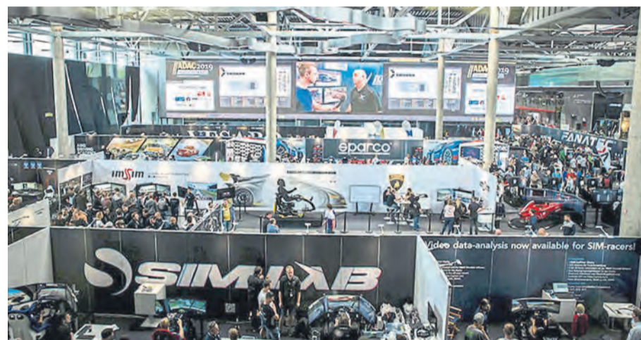
Vom 17. bis 19. September 2021 findet die ADAC SimRacing Expo am Nürburgring statt. Parallel treten Old- und Youngtimer-Tourenwagen im legendären 1000-Kilometer-Rennen auf der Rennstrecke gegeneinander an.

Setups für die eigenen vier Wände sowie alles rund um den virtuellen Motorsport.