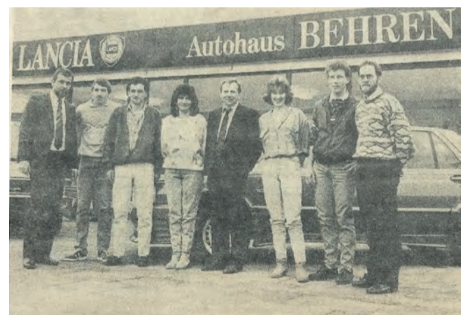
Foto aus dem Jahre 1986: Eröffnung der damaligen Niederlassung in Neuwied-Distelfeld.

gerwagen, die für Sie jederzeit bereitstehen“, so Geschäftsführer Heinz Behren. Überwiegend handelt es sich bei den Fahrzeu-