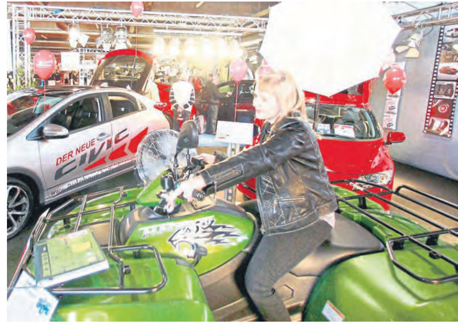
Ausprobieren ausdrücklich erwünscht... Die Neuwieder Autohändler vereinte eine Vision, die die Besucher anlockte.