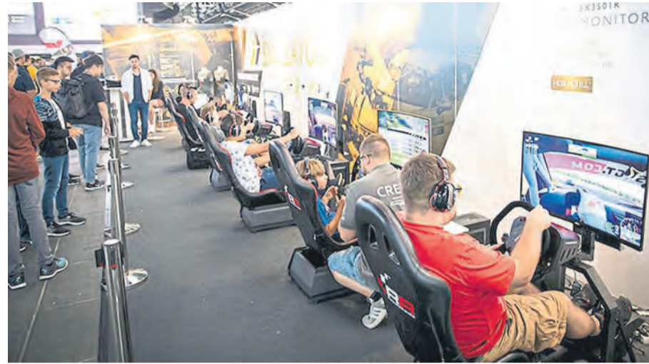
Motorsport- und SimRacing-Fans können aufatmen, denn in diesem Jahr geht es wieder zurück an den Ring.

Auch in diesem Jahr laden zahlreiche Aussteller aus allen Bereichen des digi-