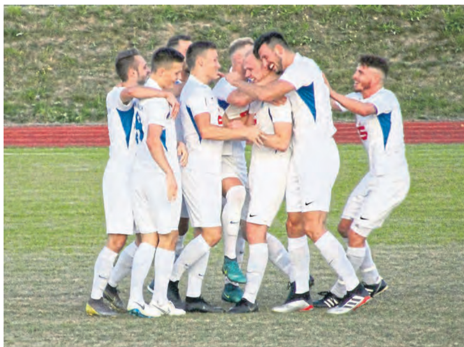
Im Jubel vereint fanden sich die Spieler der SG 2000 in den vergangenen Jahren öfter – jedenfalls dann, wenn tatsächlich auch gespielt werden konnte. Den Aufstieg 2020 feierte man auf dem Sofa und nicht auf dem Rasen.

So findet an in der Liste der Rheinlandliga-Meister des SSV Mülheim, Titelträger 1967 und 1969, hinzu kam 1967 der Rheinlandpokalsieg. Die 70er und 80er Jahre boten keine weiteren Titel. Wieder langsam nach oben zeigte die Formkurve, seit man seit 2000 eine Spielgemeinschaft mit dem SSV Urmitz-Bahnhof bildete, 2011 fusionierten die beiden Vereine zur SG 2000. Im Jahr 2009 war die SG immerhin wieder in der Rheinlandliga vertreten, musste jedoch „nachsitzen“ in Sachen Klassenverbleib – erst ein Entscheidungsspiel gegen die damals punktgleiche SG Ellscheid sorgte für Klarheit. Mit Michael Wall und Daniel Aretz zählten zwei Akteure damals schon zum Kader die auch heute noch (Aretz) bzw. wieder (Wall) dabei sind. Das schlägt sich auch in der Statistik nieder, wo Wall auf mittlerweile 181 Ligaspiele für die SG 200 kommt, Aretz bereits auf 191, in denen er 66 Mal traf. Nahe dran am Aufstieg war die SG 2000 in der Vergangenheit mehrfach, doch