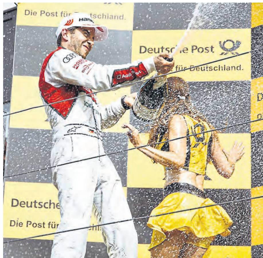
Mit Champagnerflaschen auf dem Siegerpodest hat Mike Rockenfeller reichlich Erfahrung. In der Saison 2021 ist er für das DTM-Team ABT Sportsline am Start.

„Familie und Freunde natürlich, auch wenn wir berufsbedingt verstreut sind, aber man trifft sich oft. Und meine Frau kommt aus Feldkirchen“, erzählt Rockenfeller, dessen Wohnsitz sich seit 2007 auf der Schweizer Seite des Bodensees befindet im Kanton Thurgau, unweit von Konstanz. Er kann auf eine lange und erfolgreiche Laufbahn als Rennfahrer zurückblicken – und diese ist noch nicht beendet: „Ich hoffe, dass noch ein paar gute Sachen hinzukommen“, schmunzelt der DTM-Pilot, der als gelernter Kfz-Mechaniker den Schraubenschlüssel auch selbst in die Hand nimmt. Los ging es, wie bei den meisten späteren Formel-1-Piloten, mit dem Kart-