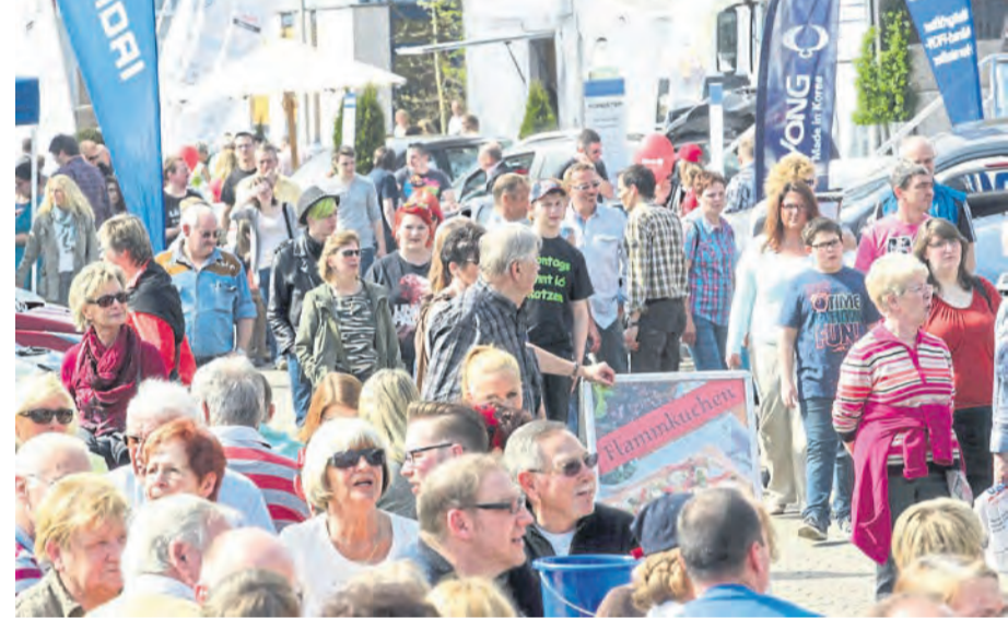
Die Automobile Faszination galt in ihren Erfolgsjahren als größte Automesse am Mittelrhein.