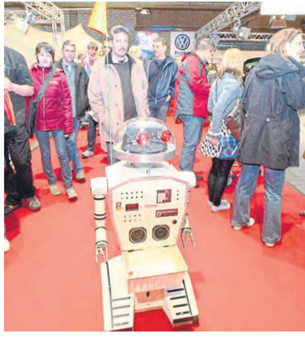
In den Hallen der SAR gestartet, rollte sie den Besuchern den roten Teppich aus.