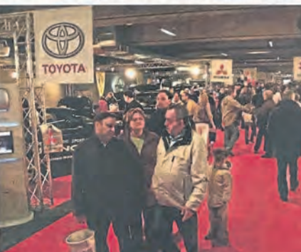
Die Besucher direkt zu den Messehallen. Gleichzeitig gibt es kostenfreie Parkplätze unter der Rheinbrücke. Auch von hier werden die Besucher mit Pendelbussen zum Ausstellungsgebiet gebracht.