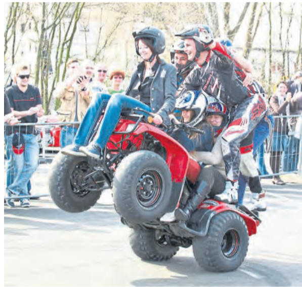
Zur neuesten Technik gab es auch immer wieder tolle Aktionen für die Besucher.