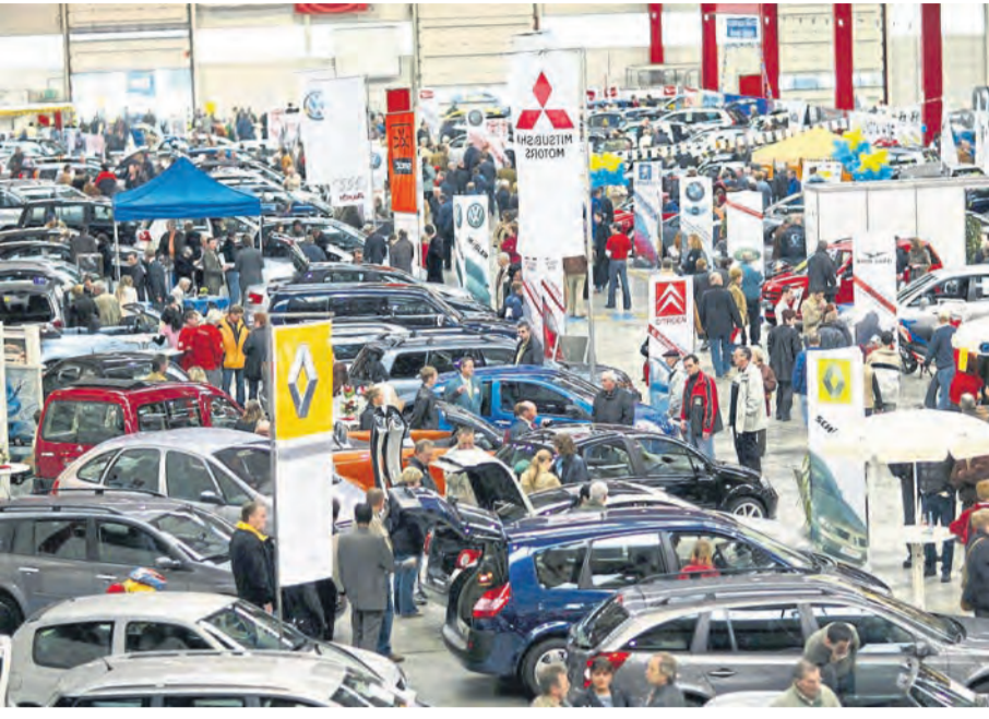
Seit 2004 gibt es die Neuwieder Autoschau, organisiert vom Zusammenschluss der Autohändler der Stadt.