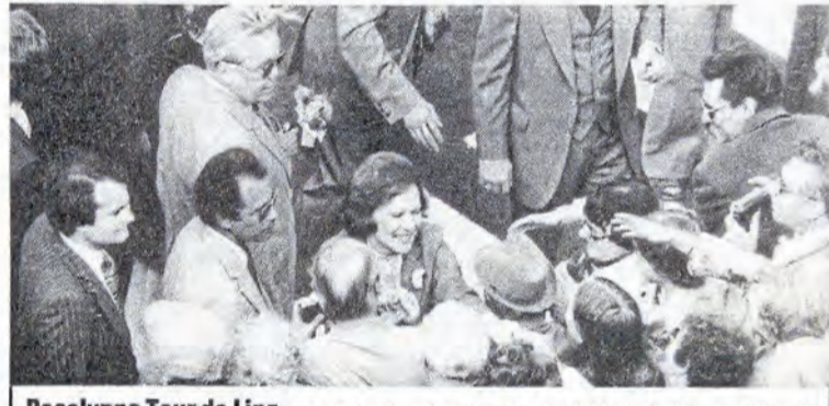
Rosalynns Tour de Linz war ein einziges Händeschütteln (Bildmitte). Wie eine Königin zog sie mit Kind und großem Gefolge in die Bunte Stadt ein, wo fast überschwengliche Begeisterung herrschte. Die zwei Stunden am Sonntagnachmittag (18. Juli) in Linz werden der Frau und Tochter des amerikanischen Präsidenten Jimmy Carter trotz vieler anderer Eindrücke noch lange im Gedächtnis bleiben.

Neuwied begeben hätten. So wie Uschi Glas 1977 zur Vorstellung ihres Films „Waldrausch“, von der die Neuwieder Rundschau natürlich berichtete (siehe Bild links). Ein fester Bestandteil unserer Zeitung ist daher auch das Kinoprogramm