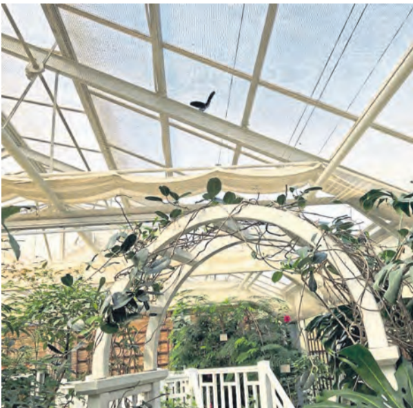
In dem großen, überdachten Garten können die Schmetterlinge inmitten der Blütenpracht fliegen.

REGION. -jke- Es ist Frühling und damit erwacht auch die Natur wieder. Morgens wird man von den ersten Sonnenstrahlen und dem Zwitschern zahlreicher Vögel geweckt und viele Wiesen sind mit blühenden Blumen übersät. Hier und da kann man auch mal einen Schmetterling erblicken, der seine Runden dreht. Doch wenn man genauer hinschaut, fällt auf, dass über die Jahre immer weniger Schmetterlinge in der Natur zu finden sind.