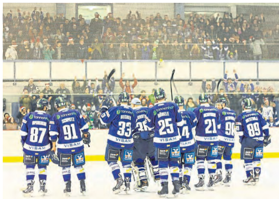
Volle Halle, eine jubelnde Mannschaft und begeisterte Fans – solche Momente würde man in der „Bärenhöhle“ gerne demnächst wieder erleben.

Angesichts solcher Bilder rückte der Sport zwar in den Hintergrund, doch die Verantwortlichen der „Bären“ um den Vorsitzen-