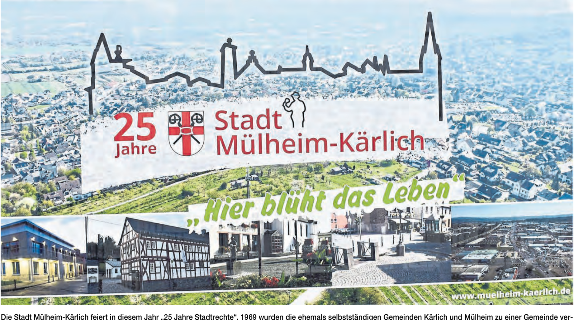
Die Stadt Mülheim-Kärlich feiert in diesem Jahr „25 Jahre Stadtrechte“. 1969 wurden die ehemals selbstständigen Gemeinden Kärlich und Mülheim zu einer Gemeinde vereint und 1996 erfolgte die Verleihung der Stadtrechte. Heute ist Mülheim-Kärlich mit über 11 500 Bürgerinnen und Bürgern die einwohnerstärkste Kommune in der Verbandskommune Weißenthurm.

Zugegeben, wirkliche Vorteile hatten die Kärlicher Bürger auch damals durch den neuen Status ihrer Stadt nicht, vielmehr diente die Erhebung zur Stadt der