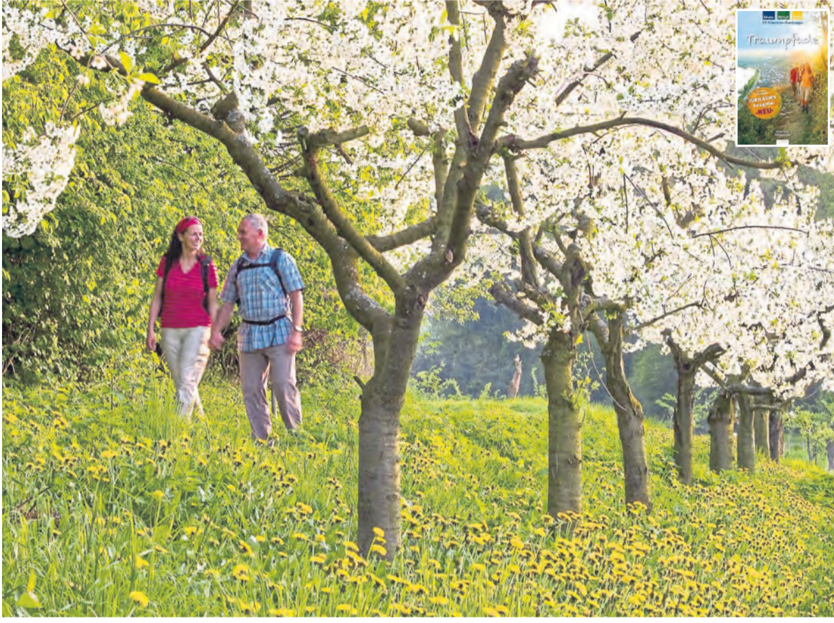
Mit den ersten Sonnenstrahlen blüht die Natur in der Verbandsgemeinde Weißenthurm auf.

VG WEISSENTHURM. Welche Pracht: Alle Jahre wieder bietet der Streuobstwiesenweg mit den ersten warmen Sonnenstrahlen ein außergewöhnliches Wandervergnügen. Der Traumpfad verläuft oberhalb von Mülheim-Kärlich in wenigen Wochen wieder mitten durch ein Meer aus Blüten. Kurzweilig führt die Route zu sensationellen Panoramablick über das Neuwieder Becken.