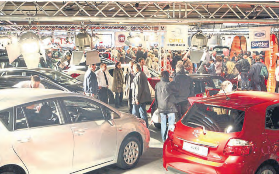
Volle Hallen waren das Markenzeichen des Automobilen Faszination - mit einem Programm für Alt und Jung.