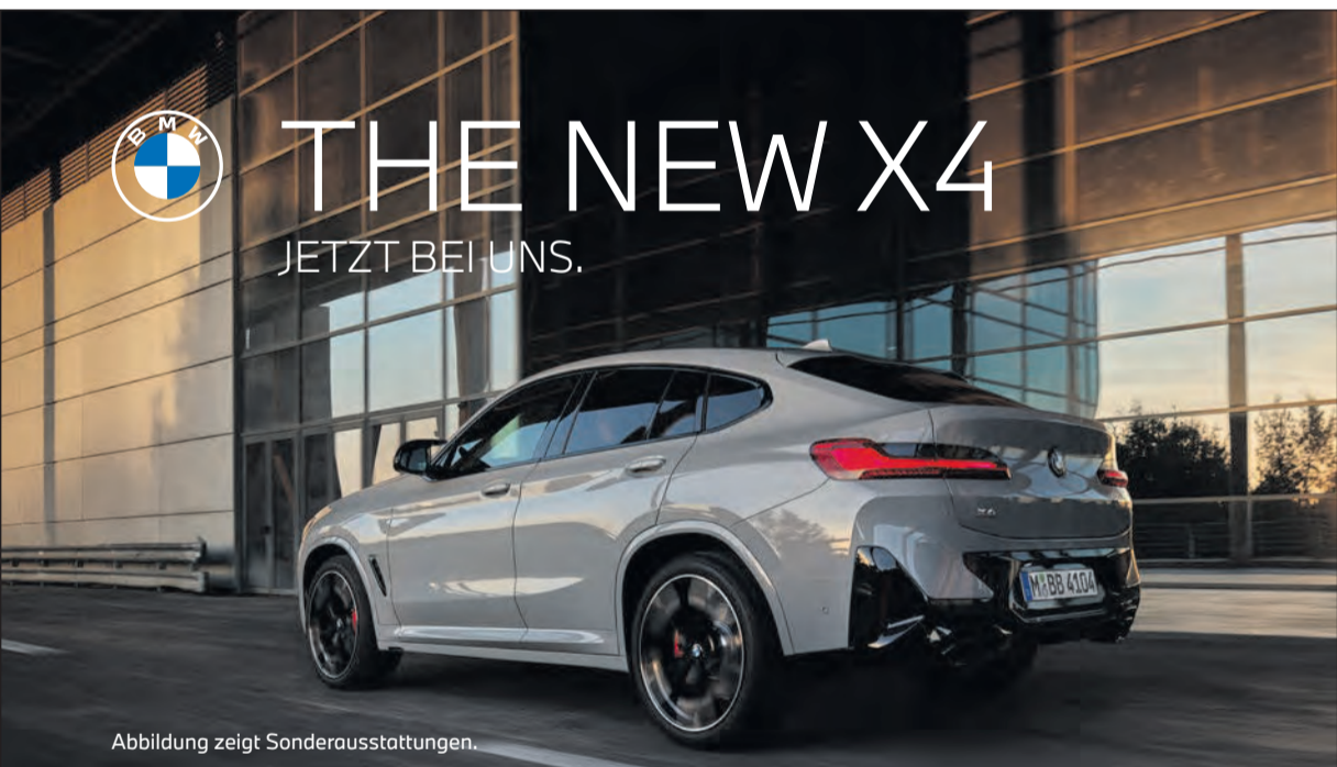
Abbildung zeigt Sonderausstattungen.

körperlich betätigen und Spaß daran haben.“ Inwiefern denn absehbar sei, irgendwann wieder ganz in die Heimat zurückzukehren? „Man soll nie nie sagen, aber mittlerweile bin ich seit 2007 in der Schweiz wohnhaft, man hat Wurzeln geschlagen, hat sein Umfeld, die Kinder gehen hier zur Schule“, zählt Rockenfeller auf. Was aber nichts daran ändert, dass die Heimat Heimat bleibt.