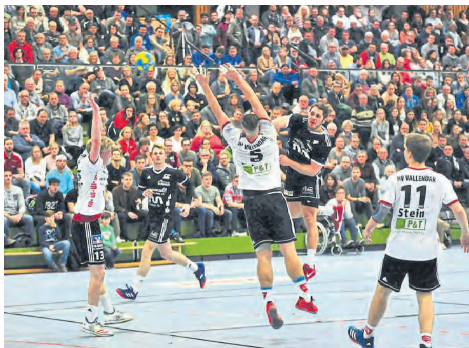
Die vollen Ränge wie hier beim Derby Mülheim gegen Vallendar zeigen, wie gut der Handball die Massen zu mobilisieren vermag.