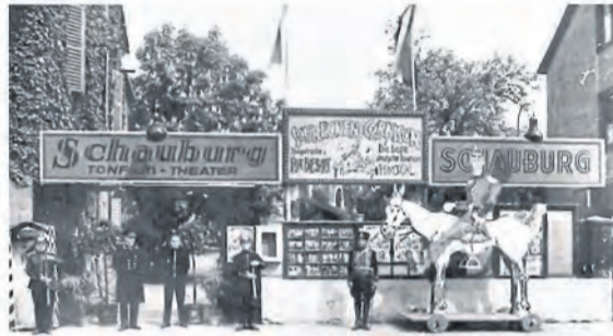
Alter Eingang zur Schauburg mit Werbung für den Film „Schrecken der Garnison“ – Bild um 1930

NEUWIED. Seit 95 Jahren steht die Familie Weiler für Kinofeeling in der Deichstadt. Über die Grenzen der Stadt ist das Kino für sein Engagement in Neuwied bekannt und seine Events sind ein fester Bestandteil im Veranstaltungskalender der Stadt. Zahlreiche Schauspieler fanden schon den Weg ins Metropal und seine „Schwesterkinos“, die sich sonst vielleicht nicht nach