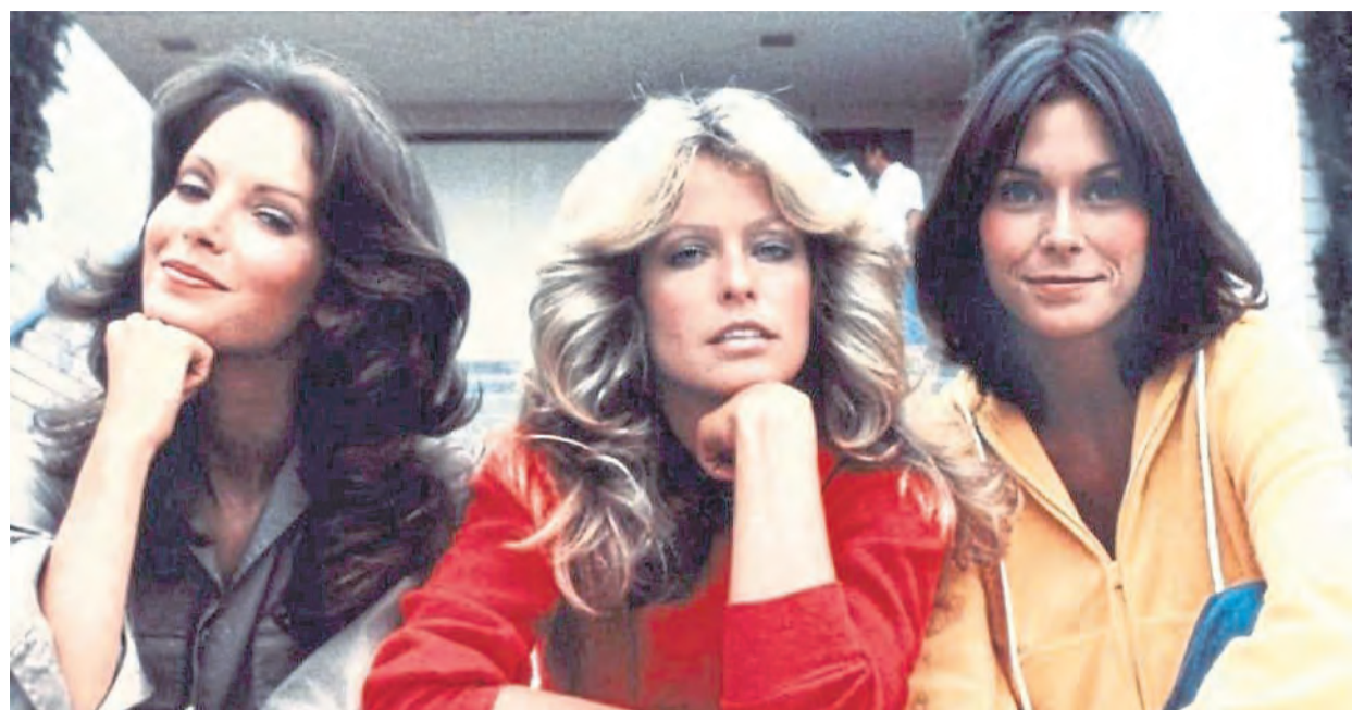
„Drei Engel für Charlie“ – die Stilikonen der 1970er machen auch heute noch eine gute Figur. Und wenn man die Dame rechts betrachtet, ist Farah Fawcetts Frisur von damals auch heute noch genau im Trend.