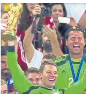
Roman Weidenfeller (rechts) mit Kollege Manuel Neuer und dem WM-Pokal.