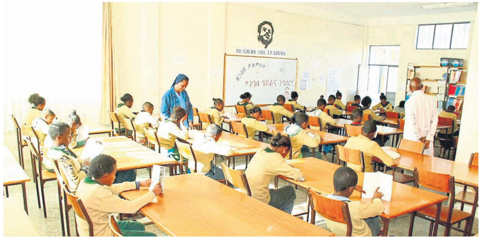
Seit über zehn Jahren können Kinder und Jugendliche in der Region der Stadt Maychew in Äthiopien in hellen und modern eingerichteten Räumen unterrichtet werden. Die Initiative hierfür und die erste Finanzierung kam vom Lions Club Limburg-Domstadt.

Bei dem derzeit aktuellen Projekt des Lions Clubs geht es um die Erfüllung von Wünschen. Unter dem Motto „Wünsche werden wahr“ erfüllen die Lions sterbenskranken Menschen letzte Wünsche. Hierfür wurde ein gebrauchter Rettungstransportwagen angeschafft und entsprechend umgebaut. Durchgeführt wird „Wünsche werden wahr“ zusammen mit dem Roten Kreuz des Landkreises. Vor Beginn der Pandemie konnten bereits erste Wünsche erfüllt werden. Nach der Corona bedingten Zwangspause soll es nun wieder weitergehen. Mit der Finanzierung mehrerer Exemplare betei-