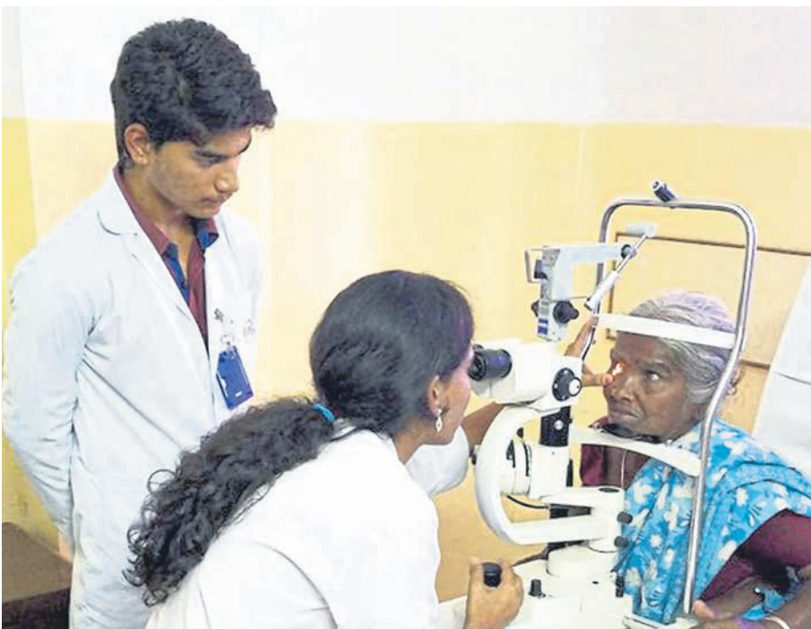
Mit einem Schwerpunkt in Indien bekämpfen die Lions seit Jahrzehnten weltweit die Ursachen von Blindheit und finanzieren Augenoperationen, insbesondere den Grauen Star.

Darüber hinaus gibt es noch weitere Lions Clubs in unserer Region: Der Lions Club Limburg-Goldener Grund, der Lions Club Limburg Mittellahn, der Lions Club Limburg Nassau und der Lions Club Weilburg/Lahn. Auch die Stadt Diez hat zwei Lions Clubs. Die Lions Idee selbst ist sehr viel älter als diese Service Clubs in unserer Region. Gegründet wurde die Lions Organisation 1917 von dem Versicherungsunternehmer Melvin Jones. Die Basis waren die Mitglieder mehrerer Herrenclubs in Chicago. Für Melvin Jones stand diese Frage und die damit verbundene Idee für die Gründung Pate: „Was wäre, wenn diese Männer, die aufgrund ihres Ehrgeizes, ihrer Intelligenz und ihrer Ambitionen so erfolgreich sind, ihr Talent zum Wohle ihrer Gemeinden einsetzen?“ Er war davon über-