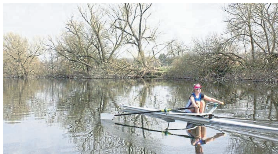
Ob in der Halle, unter freiem Himmel oder auf dem Wasser, von den Sportereignissen in der Region berichtet die Lahn-Post seit 1976.

REGION. Der Sportkreis Limburg-Weilburg e. V., geht 1976 aus dem Zusammenschluss der beiden selbständigen Sportkreise Oberlahn und Limburg hervor und vereinigt unter seinem Dach die Sportvereine des Landkreises Limburg-Weilburg. Dem Sportkreis Limburg-Weilburg e. V. gehören rund 305 Sportvereine mit über 77 000 Mitgliedern an, davon rund 24 500 Jugendliche bis 18 Jahre. Somit ist dies die größte Personenvereinigung in unserem Landkreis. Von den insgesamt 52 im Landessportbund Hessen beheimateten Sportarten werden im Sportkreis Limburg-Weilburg e. V. 38 betrieben: Badminton, Basketball, Behindertensport, Billard, Pool-Billard, Boxen, Eissport, Fechten, Fußball, Gewichtheben, Gesundheitssport, Handball, Hockey, Judo, Ju-Jitsu, Kanu, Karate, Kegeln, Leichtathletik, Luftsport, Motorsport, Motorbootsport, Radsport, Reiten, Rudern, Schach, Schießen, Schwimmen, Skilauf, Squash, Tanzen, Tauchsport, Tennis, Tischtennis, Turnen, Volleyball, Triathlon. In allen wichtigen Fragen, die den Sport im Landkreis Limburg-Weilburg betreffen, wird der Sportkreisvorstand zuvor gehört. Er ist durch seinen Vorsitzenden und Stell-