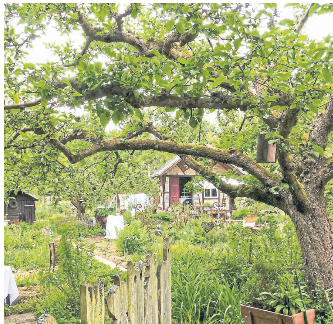
Monika Schneider hat sich im Jahr 2011 ihren Traum von einem eigenen Kräutergarten in Fachingen auf einem idyllischen Grundstück mit einem altem Baumbestand verwirklicht.