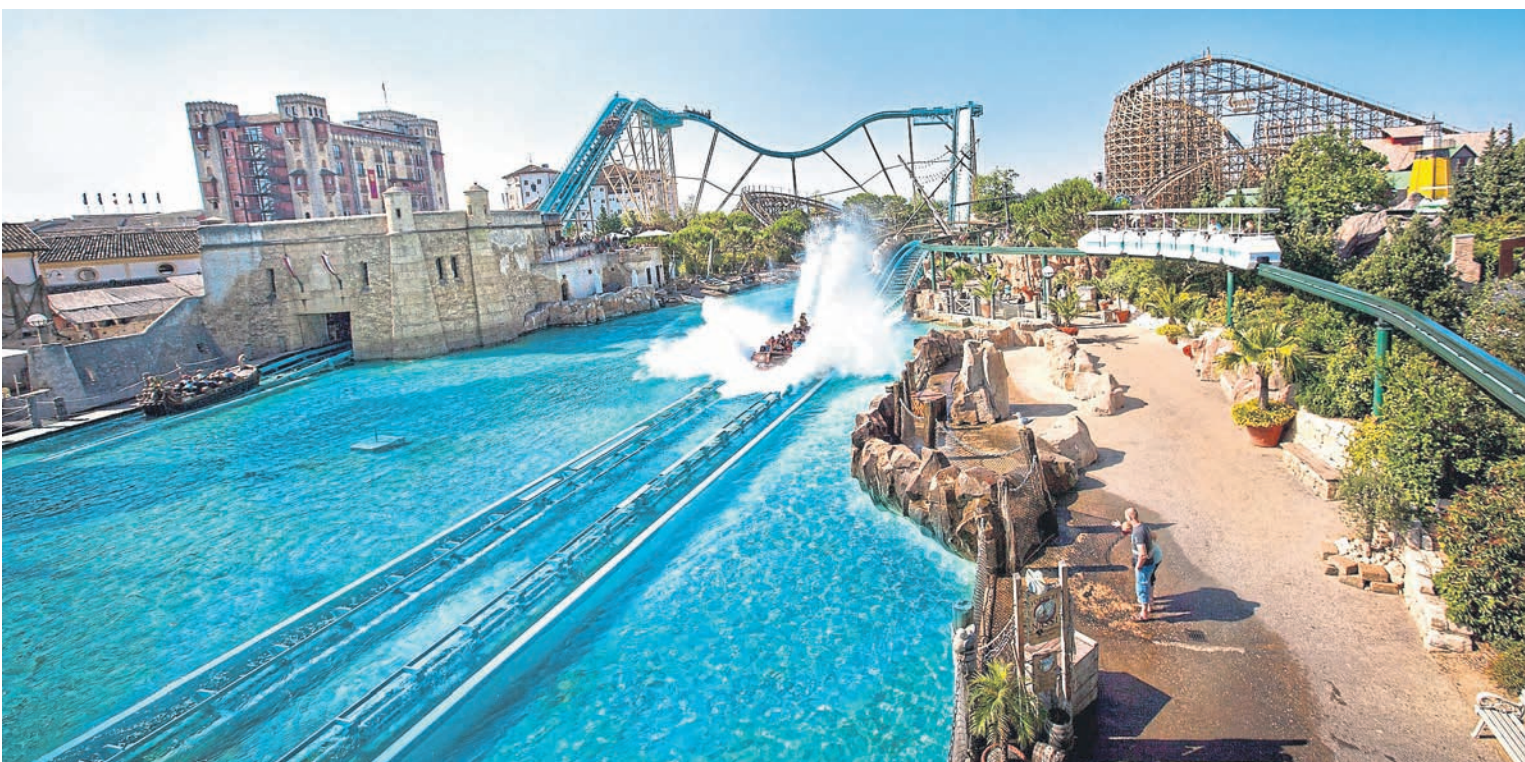
Auf die Spuren der großen Seefahrer und Entdecker begeben sich Besucher im Europa-Park bei einer rasanten wie spritzigen Bootsfahrt in „Atlantica SuperSplash“. Adrenalin-Junkies kommen bei der Achterbahn „Silver Star“ voll auf ihre Kosten.

Zum Frühstück ein Croissant in Frankreich genießen, anschließend mit dem Zug von Russland bis nach Spanien reisen und bereits am Nachmittag auf der italienischen Piazza einen leckeren Cappuccino trinken. Mit seinem besonderen Ambiente zieht der Europa-Park seit Jahrzehnten Kinder und Erwachsene in seinen Bann. Ob Island, Portugal oder Griechenland – 15 europäische Themenbereiche mit landestypischer Architektur, Gastronomie und Vegetation vermitteln Urlaubsflair. Im Herzen des Dreiländerecks Deutschland-Frankreich-Schweiz begeistert der Europa-Park mit über 100 Attraktionen. Adrenalinfans kommen in den 13 verschiedenen Achterbahnen auf ihre Kosten und können sich vom Fahrtwind erfrischen lassen. Eine Abkühlung der besonderen Art versprechen unter anderem die Wasserachterbahnen „Poseidon“ und „Atlantica SuperSplash“, bei denen die Besucher das Gefühl be-