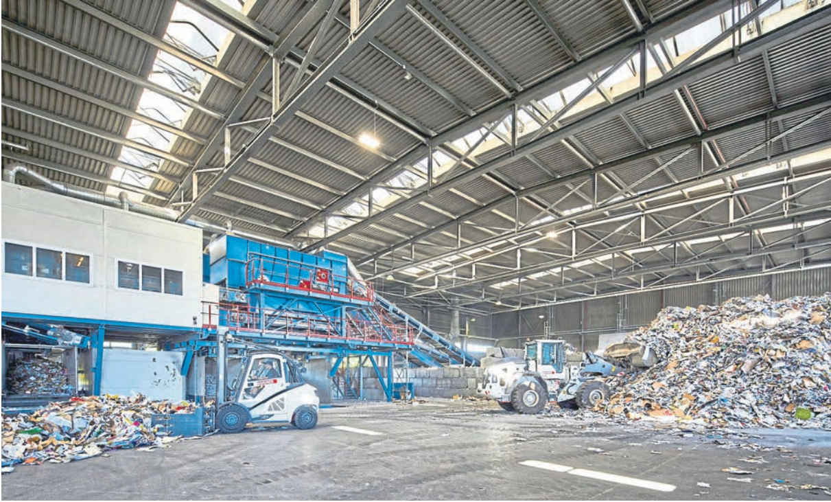
Das Herzstück des Standorts Limburg bildet eine riesige Altpapiersortieranlage.

Seit 2017 ist REMONDIS mit einer weiteren Betriebsstätte in Hohenstein-Born vertreten. Hier hat das Unternehmen eine zusätzlich Entsorgungsinfrastuktur für gewerbliche und private Kunden geschaffen. Neben einem Wertstoffhof, auf dem diverse Abfälle zu wettbewerbsfähigen Konditionen abgegeben werden können, erbringt das Unterneh-