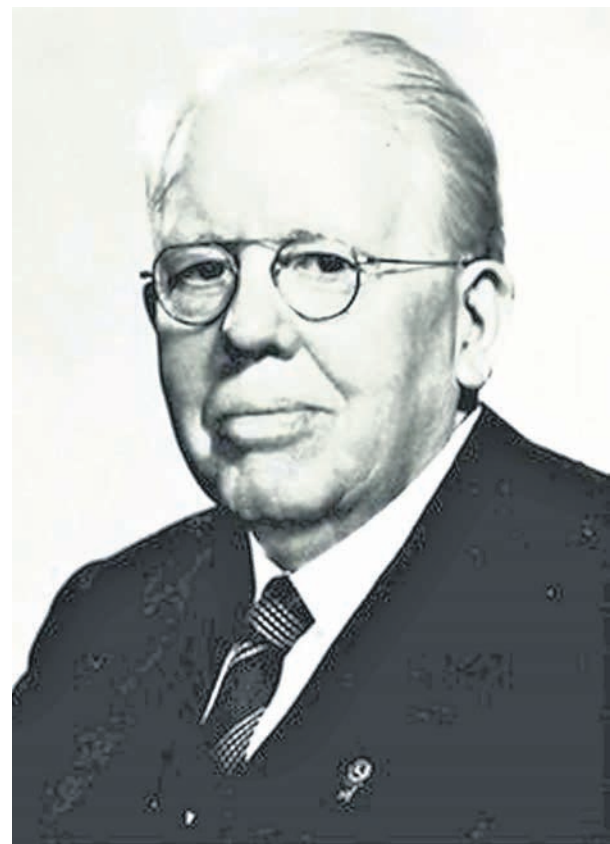
„Man kann erst dann viel erreichen, wenn man anfängt, etwas für andere zu tun“, war eine wichtige persönliche Einsicht von Melvin Jones. Er gründete in Chicago 1917 die inzwischen weltweit aktive Lions Organisation.

So startete der heimische Service Club vor Jahren die Kampagne „Limburg – Stadt mit Herz“ und finanzierte den Kauf und die Installation zahlreicher Laien-Defibrillatoren, mit denen Menschen mit einem akuten Herzstillstand sofort geholfen werden kann. Heute gehören die Geräte längst zum gewohnten Stadtbild in Limburg und leisten ihren Beitrag für das Ziel, Limburg zur „herzsicheren“ Stadt in Deutschland zu machen. Insgesamt erhielt Limburg durch diese Lions Ak-