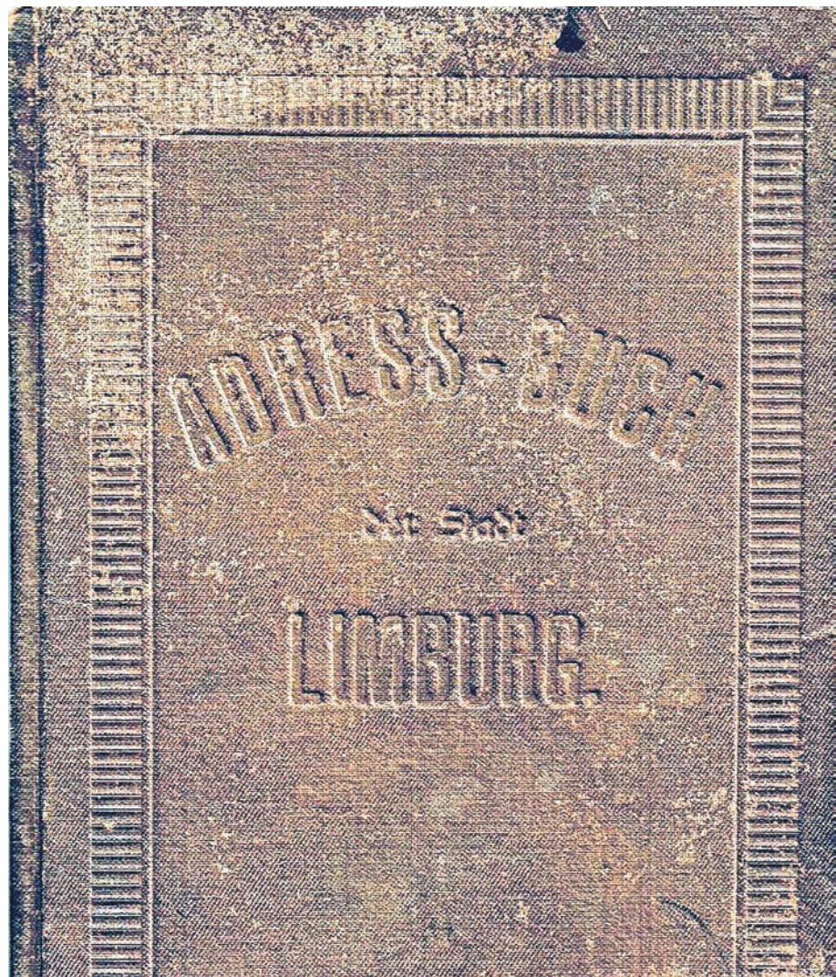
Klein und eher unscheinbar wirkt das erste Limburger Adressbuch von 1896. Es ist in die Jahre gekommen, doch je älter es wird, umso interessanter ist es für nachfolgende Generationen.

Eine wahre Fundgrube für historisch Interessierte ist der Anhang heimischer Firmen, die im Adressbuch von 1896 in kleinen und ganzseitigen Anzeigen ihre Warenvielfalt und Dienste offerierten. Das Verzeichnis weist immerhin 120 Auftraggeber aus. Offenbar wollte keiner fehlen, der zur damaligen Zeit etwas auf sich hielt. Die Amtsapotheke in der Grabenstraße gab unter anderem bekannt, dass sie eine verlässliche Bezugsquelle für echten französischen Cognac sei.