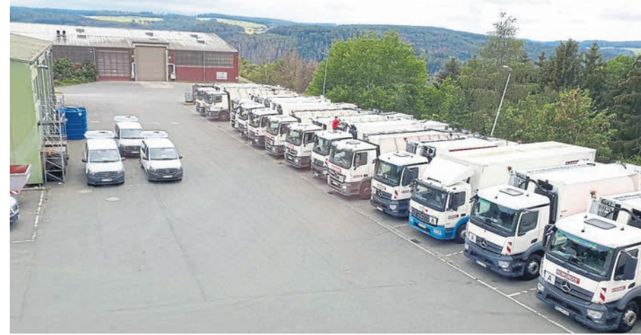
Die moderne Fahrzeugflotte an der Betriebsstätte in Singhofen.

zialist für Öl- und Fettscheiderleerungen, Nachspeicheröfen- und Öltankentsorgung, Sonderabfallabfuhr sowie Kanal-Untersuchung und -Reinigung. Die Pandemie hat auch der REMONDIS Gruppe einiges abverlangt: Die Verlagerung der Abfallströme aus dem gewerblichen in den privaten Bereich, Lockdown bei vielen Kunden sowie verschärfte Hygienebedingungen sind nur einige der Herausforderungen, die jedoch dank dem Einsatz der engagierten Mitarbeiter*innen bravourös geleistet werden. Die Betriebe von REMONDIS blicken daher optimistisch in die Zukunft und möchten ihre Marktposition weiter stärken.