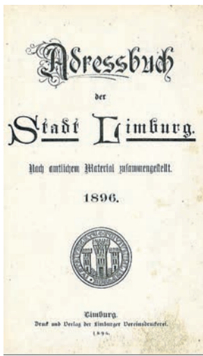
Das erste Blatt im ersten Adressbuch der Stadt Limburg.

Mit diesem historischen Rückblick auf Limburgs hervorragende Bedeutung im Lahngbiet beschreibt das Büchlein allerlei Sehenswürdigkeiten in der Domstadt und leitet anschließend auf die Umgebung über. Der Autor gibt den Hinweis, dass es in der unmittelbaren Umgebung der Stadt keine größeren Waldpartien, wohl aber zwei sehr schöne Aussichtspunkte gibt: den Greifenberg und den Schafsberg.“ Als weiterer Bereich der Umgebung wird der neue geräumige Friedhof genannt. Sodann werden die Dörfer vorgestellt, „die gleich einem Kranze die Stadt umgeben“.