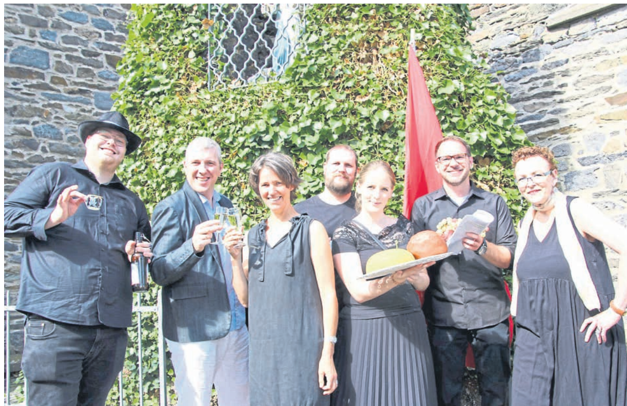
Die Schauspieler der Amateurbühne „theater am bach“ freuen sich auf die kommenden Auftritte.

Im vergangenen Jahr wollte die Amateurbühne „theater am bach“ aus Elz ihr 25-jähriges Vereinsjubiläum groß feiern. Zahlreiche Veranstaltungen für alle Generationen waren geplant, um die Vielfalt des Theaters zu zeigen. Und dann kam Corona. Kurz bevor die Werbung für die Veranstaltungen rausgehen sollte, kam der Lockdown und alles musste abgesagt werden. Als sich im Sommer die Situation entspannte, war sich der Vorstand schnell einig, den Menschen ein kulturelles Angebot zu machen. Mit einem umfangreichen Hygienekonzept für die Proben und die Aufführungen nahm das Ensemble die Probenarbeiten für das Bühnenstück „Frau Müller muss weg“ in Angriff. Doch auch hier machte Corona den Darstellern einen