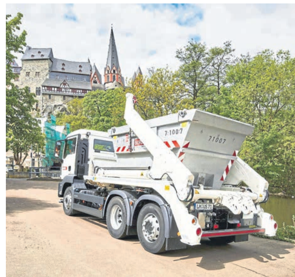
Auch ein Containerdienst wird am Standort Limburg angeboten.

zialist für Öl- und Fettscheiderleerungen, Nachspeicheröfen- und Öltankentsorgung, Sonderabfallabfuhr sowie Kanal-Untersuchung und -Reinigung. Die Pandemie hat auch der REMONDIS Gruppe einiges abverlangt: Die Verlagerung der Abfallströme aus dem gewerblichen in den privaten Bereich, Lockdown bei vielen Kunden sowie verschärfte Hygienebedingungen sind nur einige der Herausforderungen, die jedoch dank dem Einsatz der engagierten Mitarbeiter*innen bravourös geleistet werden. Die Betriebe von REMONDIS blicken daher optimistisch in die Zukunft und möchten ihre Marktposition weiter stärken.