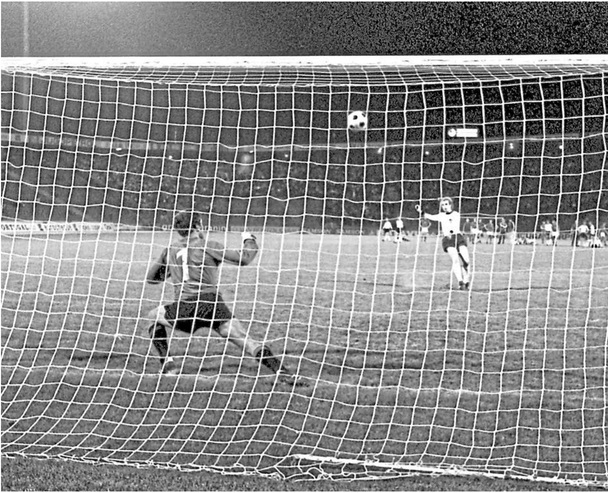
Der verhängnisvolle Schuss im Elfmeter-Duell am 20. Juni 1976 in Belgrad im Europameisterschaftfinale zwischen der deutschen Fußballnationalmannschaft und der CSSR beim Stand von 2:2 nach 90 Minuten und der Verlängerung: Torhüter Ivo Viktor schaut gebannt zu, wie der deutsche Mittelfeldspieler Uli Hoeneß (hinten) den Ball über die Latte knallt. Die DFB-Elf verliert am Ende mit 3:5.

Musikalisch schlug zum Beispiel Jürgen Drews in diesem Jahr „Ein Bett im Kornfeld“ auf, das noch heute in der Schinkenstraße auf Mallorca für Stimmung sorgt. Marianne Rosenberg sang die „Lieder der Nacht“ und für Peter Alexander war „Die kleine Kneipe“ ein besonderer Sehnsuchtsort. Costa Cordalis erinnerte an „Anita“ und von Gunter Gabriel gab es die eindeutige Aufforderung „Komm unter meine De-