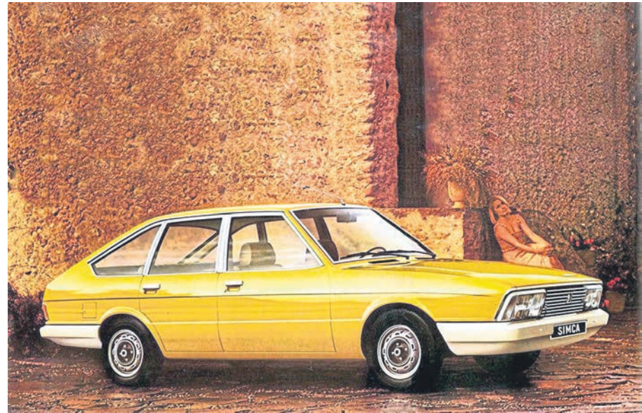
Der Simca 1307/1308 war 1976 das „Auto des Jahres“.

scheinen der ersten Lahn-Post war 1976 ein neuer Bundestag gewählt worden. Trotz eines erheblichen Zugewinns der CDU/CSU auf 48,6 Prozent der abgegebenen Stimmen, kam es zu einer sozial-liberalen Bundesregierung von SPD (42,6 Prozent) und FDP (7,9