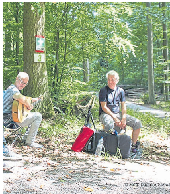
„Kultur ist Kommunikation im besten Sinne und bringt die Menschen zusammen heißt es bei den Aktion im Rahmen des Kulturprogramms Dialog Aar-Einrich.“

Kultur gemeinsam erleben ist dynamisch, inspirierend und regt die Sinneswahrnehmung an. So entsteht Energie für Neues – und genau das kam in den vergangenen Monaten bereits hervorragend an, auch wenn natürlich einige Veranstaltungen zunächst verschoben werden mussten. Wenn sie dann stattfanden, waren die Gäste berührt, begeistert und dankbar für das, was Kultur mit ihnen macht. Das Festival Dialog Aar-Einrich bündelt Kulturaktivitäten in der Region, um bewusst zu machen, was es in der neuen gemeinsamen Heimat-VG alles gibt und lockt die Menschen gern auch mal an ungewöhnliche Locations. Ein besonders Beispiel waren die Wood Vibrations: Das Publikum wandelte fast fünf Kilometer über den Radweg, der die beiden ehemals autarken Verbandsgemeinden verbindet, mitten durch den Wald. Und dort überall verstreut saßen Musikgruppen, Künstler, Geschichtenerzähler und machten den Wald zu einer belebten Bühne. Ein großartiges Erlebnis für alle Beteiligten! Auch die Stummfilmabende mit Live-Musik im Kreml oder eine unglaublich über-