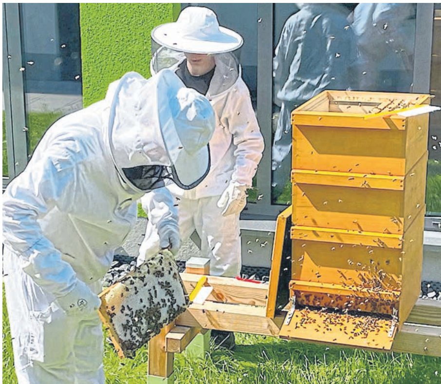
Vorsichtig werden die Waben aus den Bienenstöcken entnommen.

Schüler: Herr Laux, wie viele Bienenvölker gibt es an der FDS und um wel-