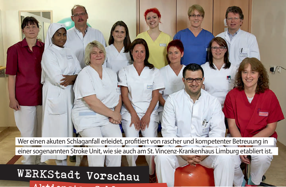
Wer einen akuten Schlaganfall erleidet, profitiert von rascher und kompetenter Betreuung in einer sogenannten Stroke Unit, wie sie auch am St. Vincenz-Krankenhaus Limburg etabliert ist.