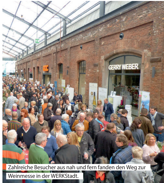
Zahlreiche Besucher aus nah und fern fanden den Weg zur Weinmesse in der WERKStadt.