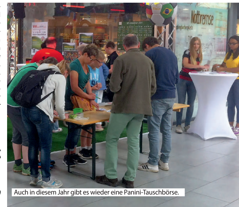
Auch in diesem Jahr gibt es wieder eine Panini-Tauschbörse.