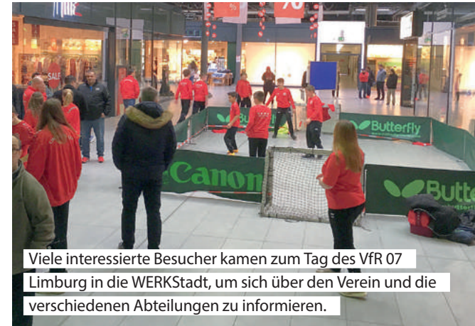
Viele interessierte Besucher kamen zum Tag des VfR 07 Limburg in die WERKStadt, um sich über den Verein und die verschiedenen Abteilungen zu informieren.