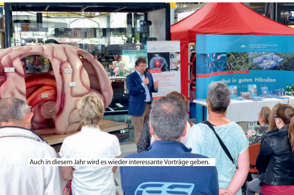
Auch in diesem Jahr wird es wieder interessante Vorträge geben.