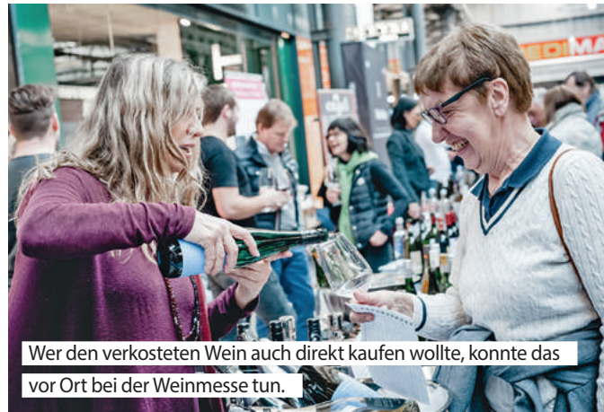
Wer den verkosteten Wein auch direkt kaufen wollte, konnte das vor Ort bei der Weinmesse tun.